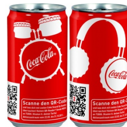
Verpackungen von Produkten